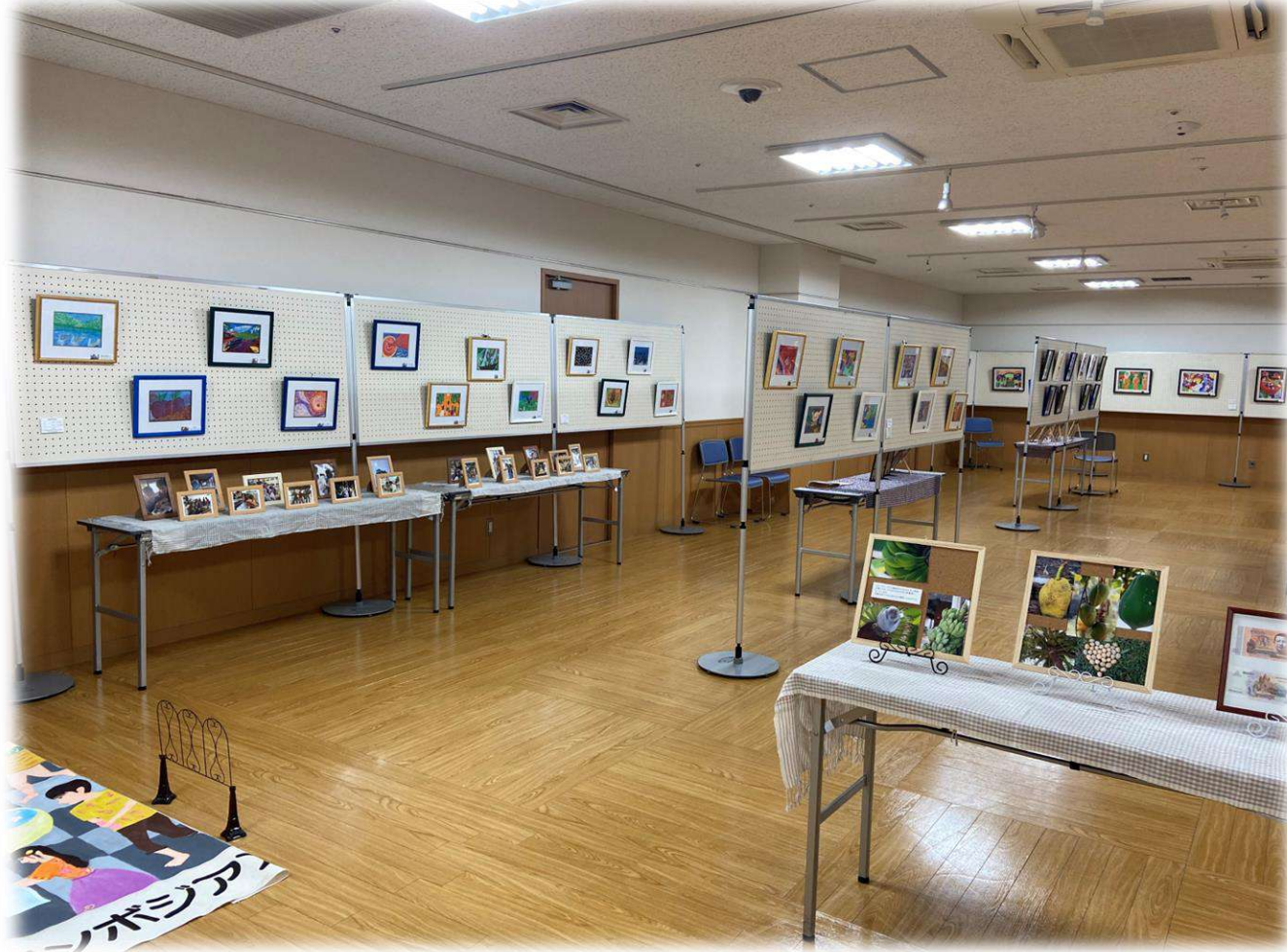
和歌山 フォルテワジマ 2011年～